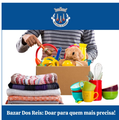
Bazar Dos Reis: Doar para quem mais precisa!