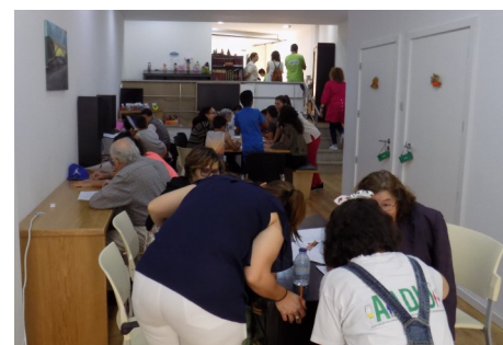
Fotografia de julho de 2019

Na sequência da iniciativa «Adota um avô» - uma ação de promoção do convívio, confraternização e a aproximação de gerações, seniores e jovens - promovida, pela primeira vez, a 05 de julho de 2019, e na impossibilidade de dar continuidade a esta iniciativa nos mesmos moldes, a Comissão Social de Freguesia está a adaptar esta tipologia às condicionantes atuais, permitindo que seniores e jovens mantenham o contacto por carta, estreitando laços e mantendo o espírito criado e que se pretende desenvolver e fomentar no futuro.